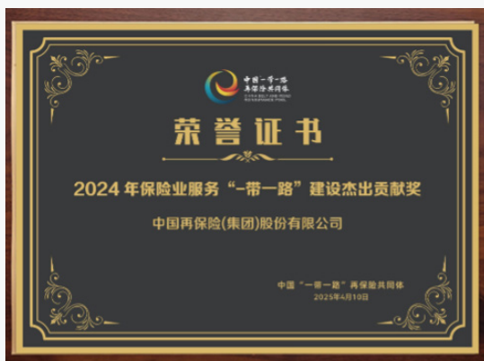
中国再保获得 2024 年保险业服务 “一带一路”建设杰出贡献奖