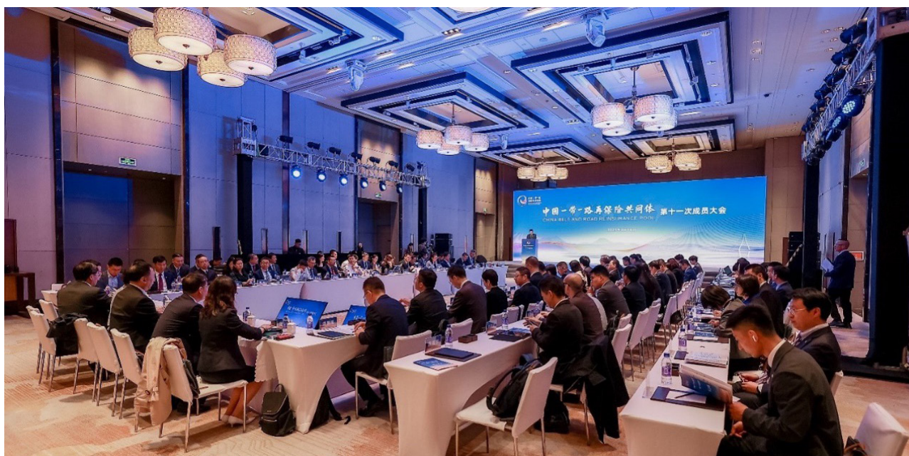
中国“一带一路”再保险共同体第十一次成员大会

中再产险作为国内财产再保险主渠道和国际市场主要参与者，全面助力“一带一路”倡议和人类命运共同体建设。通过不断深化与各方战略对接和金融合作，积极推进“一带一路”产品与服务创新，有力支持“走出去”战略与“一带一路”建设高质量发展。由中再产险担任管理机构的中国“一带一路”再保险共同体成立 5 年以来，成员从 11 家发展壮大到 24 家，实现了对中国海外利益商业合约限制或除外的工程险、财产险业务的全覆盖，累计承保项目 233 个，覆盖 43 个国家和地区，累计保障境外资产规模达 2,516 亿元。2025 年承保重大标志性工程和重点项目 91 个，提供风险保障 1,023 亿元，同比增长 29%。