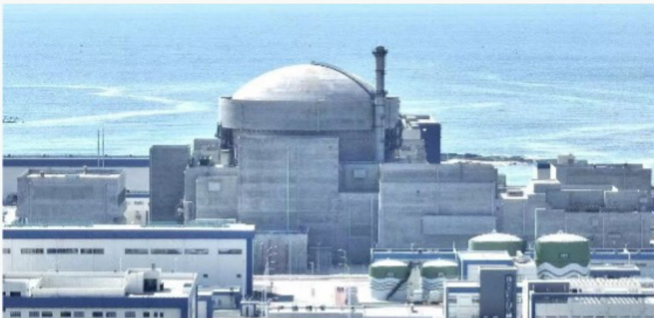
中广核广东太平岭核电厂

2025年，中国核共体完成了对国家重大科技专项——“国和一号”示范工程2号机组和“华龙一号”批量化建设项目——漳州核电厂2号机组、太平岭核电厂1号机组、三澳核电厂1号机组等多个新建成项目的保障工作，合并其他续保的“华龙一号”“AP1000”“EPR”、高温气冷堆示范工程、快中子反应堆等先进核电项目，为新技术堆型提供的年度风险保额超2,000亿元。中国核共体是全球范围内为先进核电技术（第三代、第四代核电机组等）提供保险保障额度最高、经验最丰富的核共体。