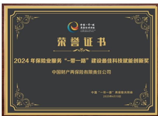
中再产险获得 2024 年保险业服务 “一带一路”建设最佳科技赋能创新奖